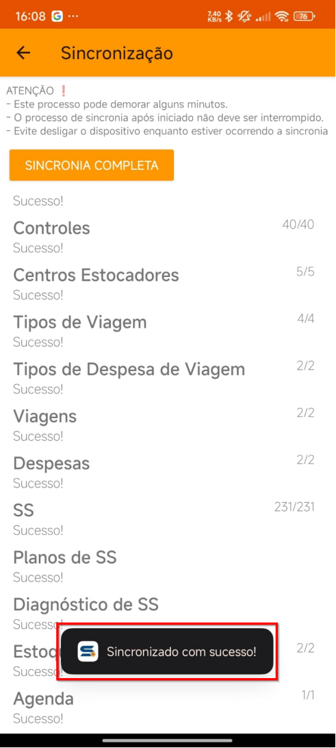
Tela de sincronia realizada com sucesso.