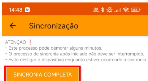
Tela de sincronia