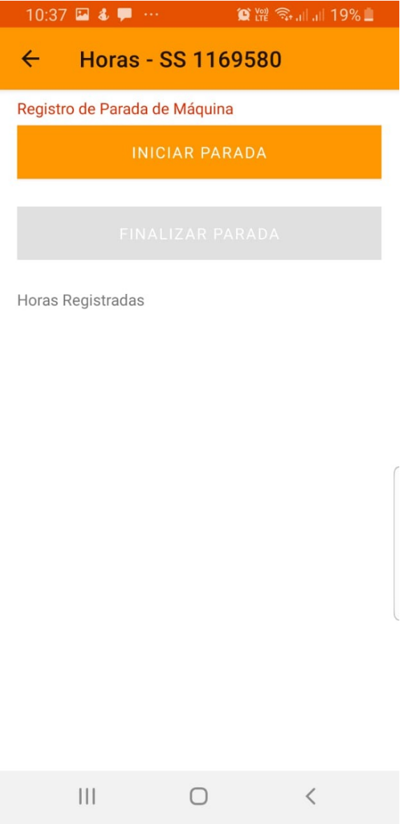
Tela de ações da SS - Horas trabalhadas do técnico - Lançamento de parada de máquina

Revisão #2 Criado 31 October 2024 11:09:27 por GABRIEL BORGES PETERS Atualizado 1 November 2024 14:45:54 por Lucas Monteiro