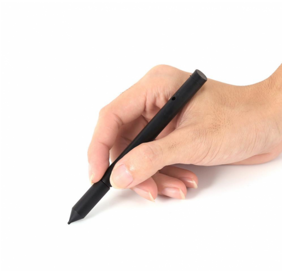
Exemplo de caneta capacitiva ponta fina para dispositivos