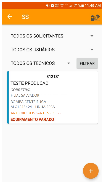
Tela de listagem de SS no APP