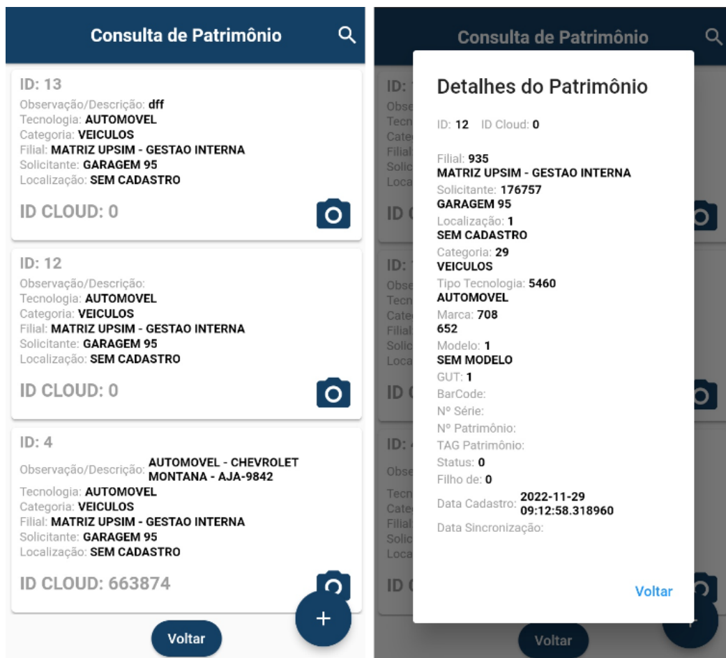
Tela de consulta e de detalhes do patrimônio